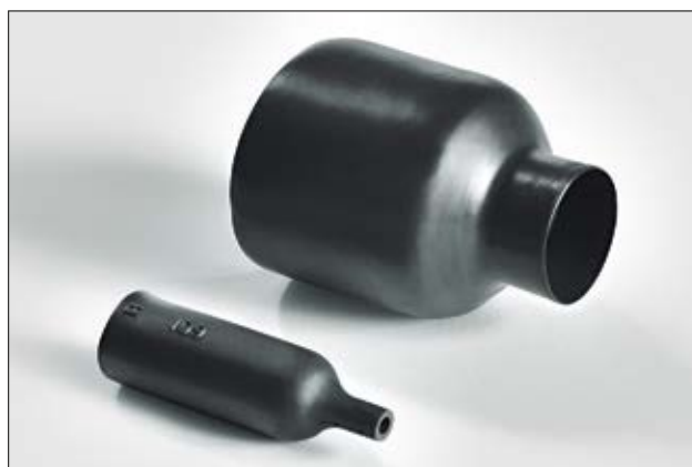
Série 100, avant et après rétreint.