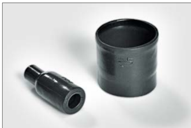
Série 100, avant et après rétreint.