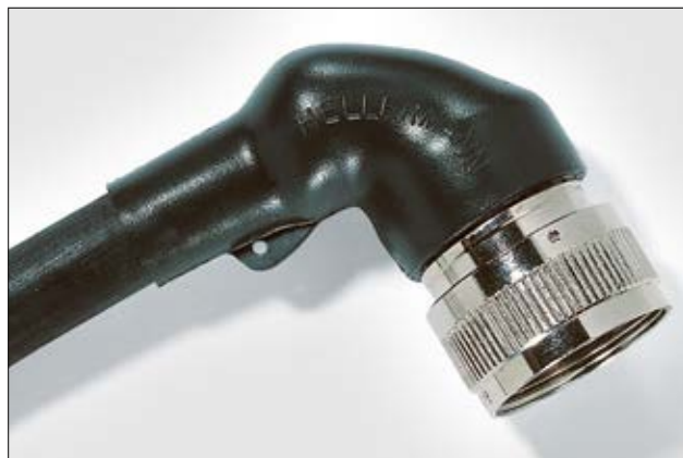
1152-4-G, montée sur un connecteur.