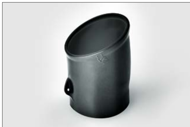
Série 1100, expansée.

Pour plus d'informations sur les différents matériaux et adhésifs, voir page 272, 273.