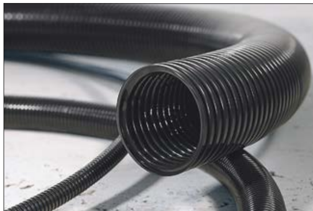
HelaGuard HG-FR offre une excellente protection à la flamme.