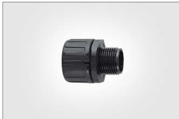
Raccord plastique droit avec filetage externe fixe HG-S PA66, IP66.

Les raccords avec filetage tournant PG sont également disponibles. Pour notre gamme complète de gaines et raccords, veuillez consulter notre catalogue HelaGuard.