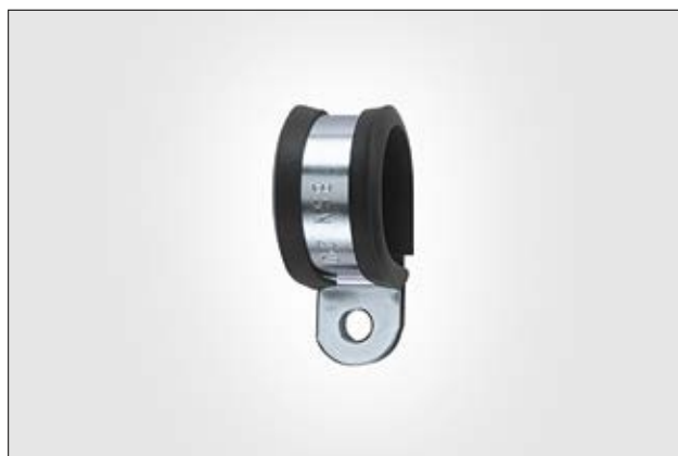
Bride de fixation AFCS en acier galvanisé, avec profilé en PVC.