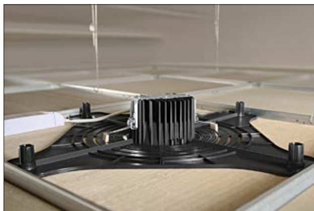
SpotClip-Plate, plaque de renfort pour downlights en plafonds suspendus.

Il suffit alors de couper à l'aide d'une scie à métaux les ergots qui maintiennent la zone à enlever.