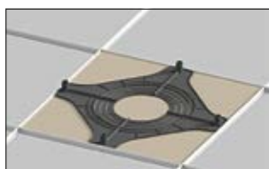
1. Positionnez le SpotClip-Plate sur la plaque minérale (600 x 600 mm) avant de la découper.