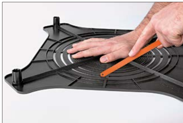
Couper à l'aide d'une scie à métaux les 8 ergots qui maintiennent la zone à retirer.