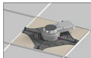
4. Positionnez la lampe et finalisez l'installation.