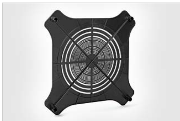
SpotClip-Plate est adapté aux plafonds suspendus avec des plaques minérales en 600x600.