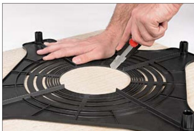
Positionner le SpotClip-Plate sur la plaque minérale (600 x 600 mm) avant de la découper.