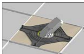
3. Faites passer le Downlight au travers du faux plafond.