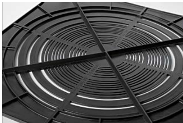
Repères de découpe de Ø 75 à Ø 314 mm.