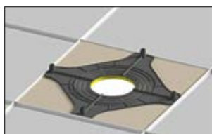
2. Découpez le faux plafond en fonction du diamètre retenu.