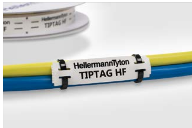
TIPTAG - pour une identification haute performance des faisceaux et harnais.