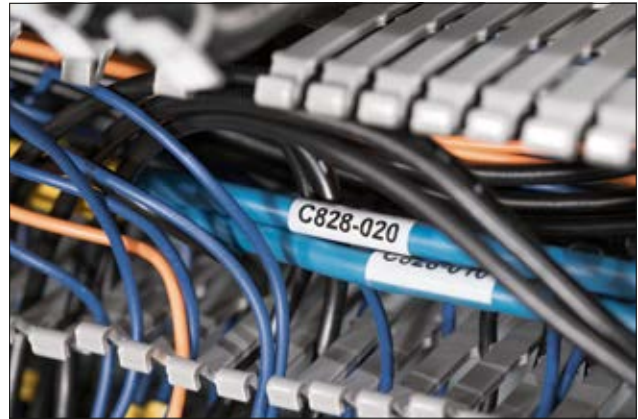
Les étiquettes Helatag 1209 offrent une excellente protection contre l'abrasion et les intempéries.