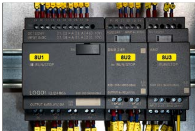
Etiquettes adhésives en application sur un routeur