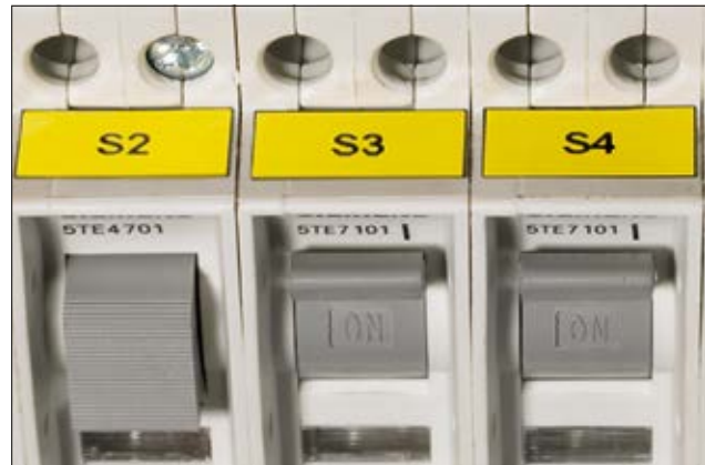
Une identification claire vous assure une gestion plus efficace.