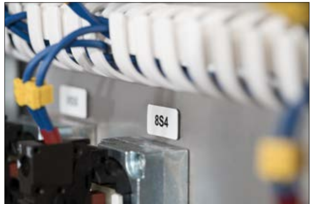
Etiquettes pour identification de boutonerie Helatag 1220 - Adhésif haute performance qui assure une adhésion optimale sur des surfaces irrégulières.

Créer simplement les modèles de vos étiquettes en utilisant le logiciel TagPrint Pro.