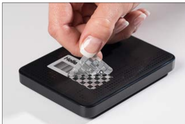
Signe d'inviolabilité très visible.