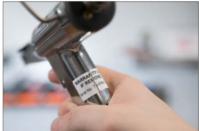
Helatag 1208 - Une solution sécurisée pour identifier si les étiquettes ont été détériorées.