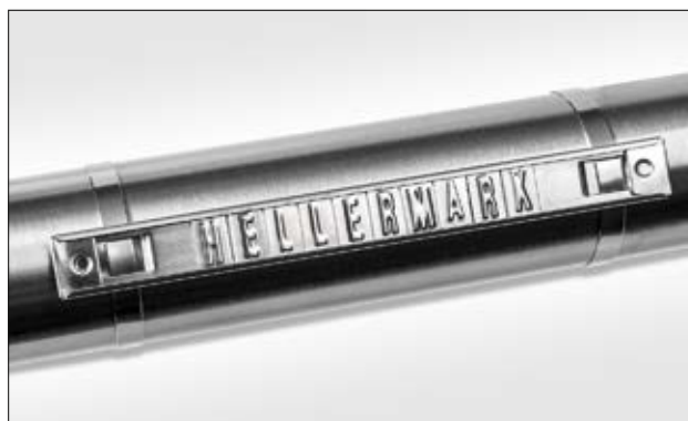
Hellermark SSC et SSM.