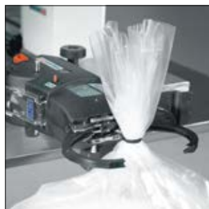
Application de conditionnement - Banc fixe horizontal équipé de l'ATS3080.