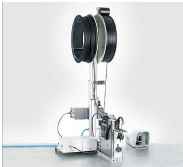
Ensemble comprenant le banc fixe vertical avec la pédale, l'outil ATS3080, l'alimentation secteur et les deux rouleaux de consommable.