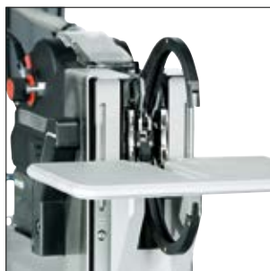
En option: Plaque à ajouter sur banc fixe vertical pour ATS3080.