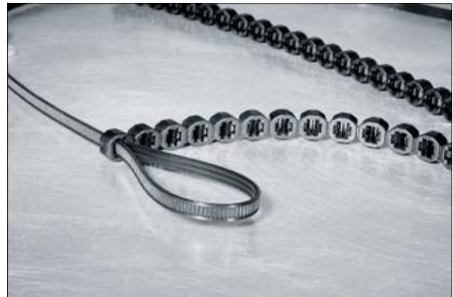
Têtes de verrouillage et bande continue pour ATS3080.