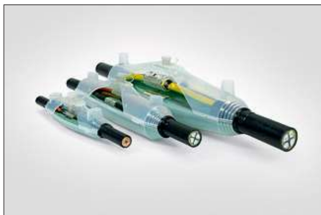
Boîte de jonction droite i-Line avec système Safe Filling (SF).