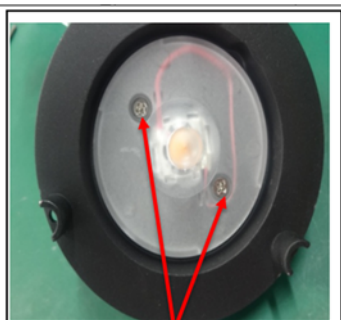
Figure 2 Remove the screws