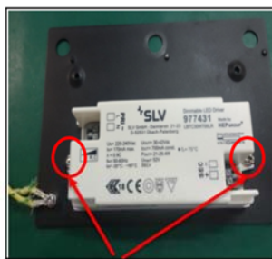
Figure 4 Remove the screws