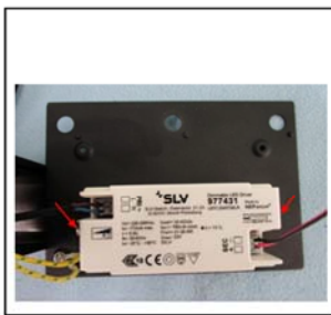
Figure 3 Remove the wires