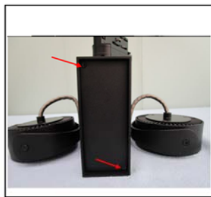
Figure 1 Remove the screws