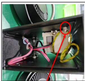
Figure 2 Remove the screws