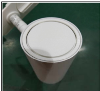
Figure1 Remove the top cover