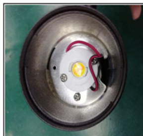
Figure3 Remove the reflector