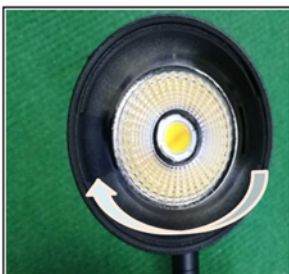
Figure2 Remove the front cover