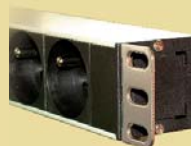
Orientation tous les 90°