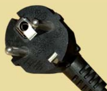
Fiche mâle DIN 49441 16A