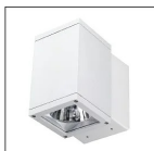
QUADRO MONO MCL