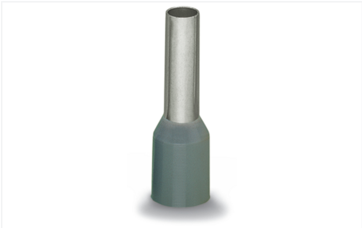
Couleur: ■ gris