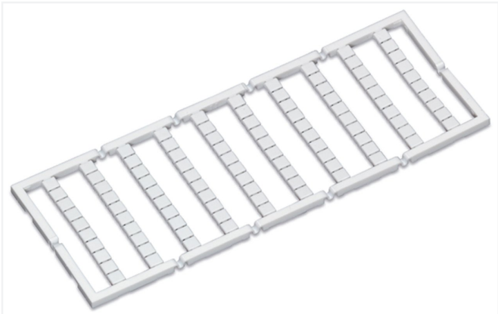
Couleur: blanc Identique à la figure