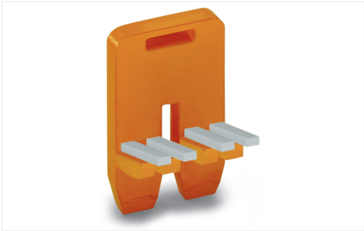
Couleur: ■ orange Identique à la figure