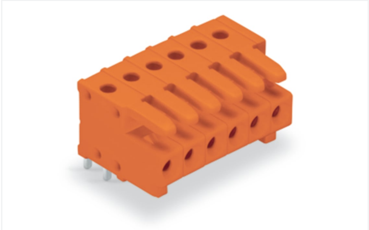
Couleur: ■ orange