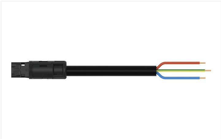
Couleur: ■ noir