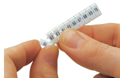
Débranchement d'une étiquette de la bande de marquage WMB, pour les largeurs de bornes supérieures