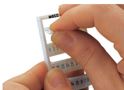
Débranchement d'une bande de la carte WMB.