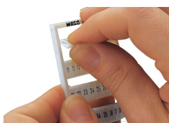
Débranchement d'une bande de la carte WMB.