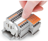
Encliquetage d'une bande de marquage WMB dans le logement de marquage