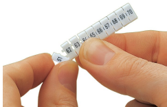
Détachement d'une étiquette de la bande de marquage WMB, pour les largeurs de bornes supérieures