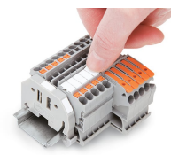
Encliquetage d'une bande de marquage WMB dans le logement de marquage