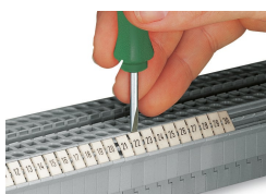
Encliquetage d'une bande de marquage WMB dans le logement de marquage