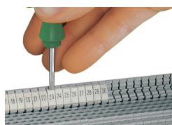
Encliquetage d'une bande de marquage WMB dans le logement de marquage du double porte-étiquettes