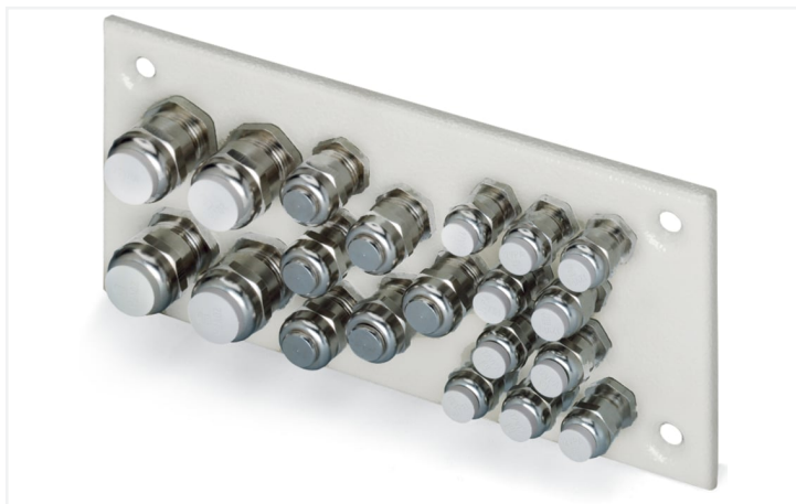
Identique à la figure