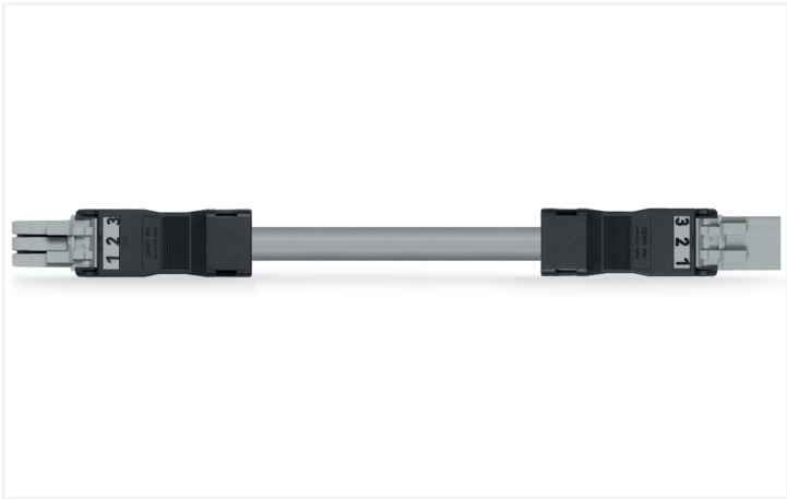
Couleur: ■ gris