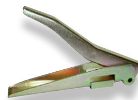
Pince à replier