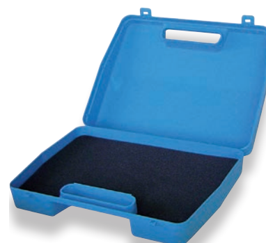
Coffret de rangement outils feuillard