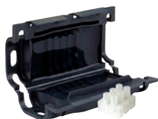
Boite gel jonction 3x2,5 (HC004)