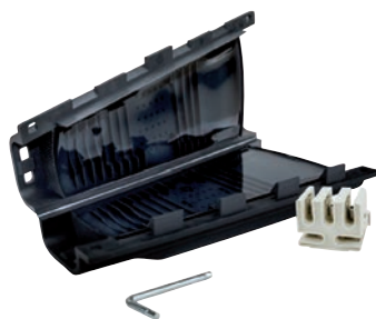
Boite gel jonction-dérivation (HC009-HC010)