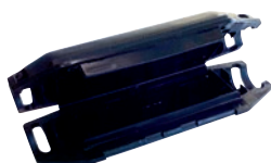
Boite gel seule T.1 (HC001)