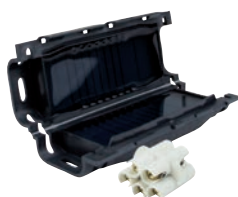
Boite gel jonction 5x6 (HC005)