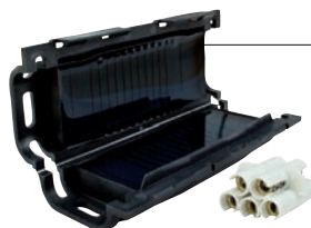
Boite gel jonction 5x16 (HC006)