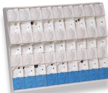
Jeu de barres 450 (Q601)