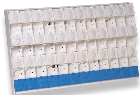
Jeu de barres 600 (Q602)

Les jeux de barres 300, 450 et 600 offrent respectivement 6, 9 et 12 plages de raccordement pour chaque pôle.