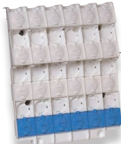
Jeu de barres 300 (Q600)