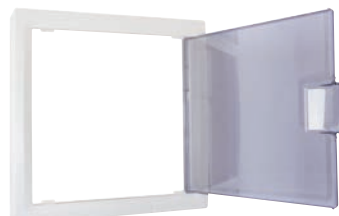
Habillage TDC principal (LB011)