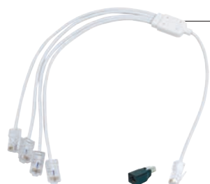
Cordon quadruple téléphone/RJ45 (Q293)

Le cordon quadruple téléphone/RJ45 sert à quadrupler les sorties téléphone issues du filtre maître ou de la box.