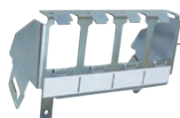
Support 4 RJ45 (LB017)