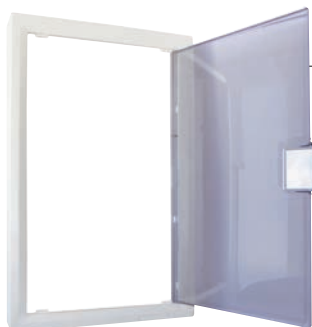
Habillage zone attenante (LB012)

Les habillages NÉO donnent une apparence moderne de mini-baie de brassage résidentielle au tableau de communication tout en le protégeant.