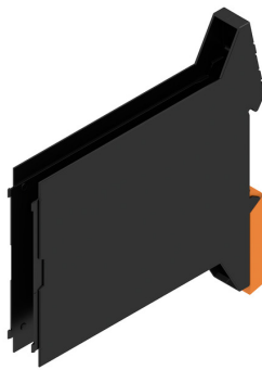
Illustration du produit