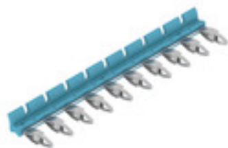
Illustration du produit