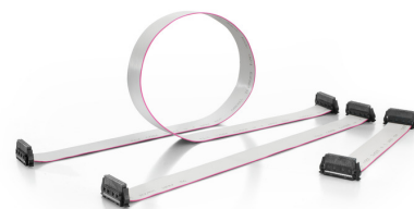
Three standard lengths (0.1 m, 0.2 m, and 0.5 m)