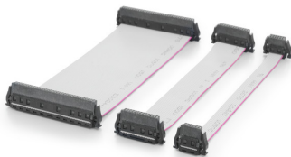
Three standard lengths (0.1 m, 0.2 m, and 0.5 m)