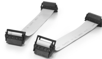
With optional strain relief