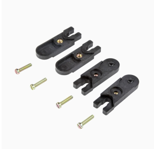
Pattes de fixation extérieures Jeu de 4 pièces