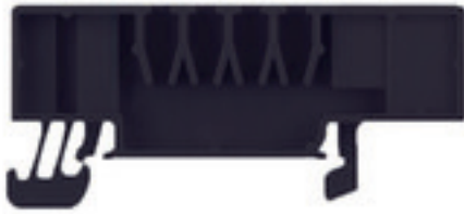
Illustration du produit